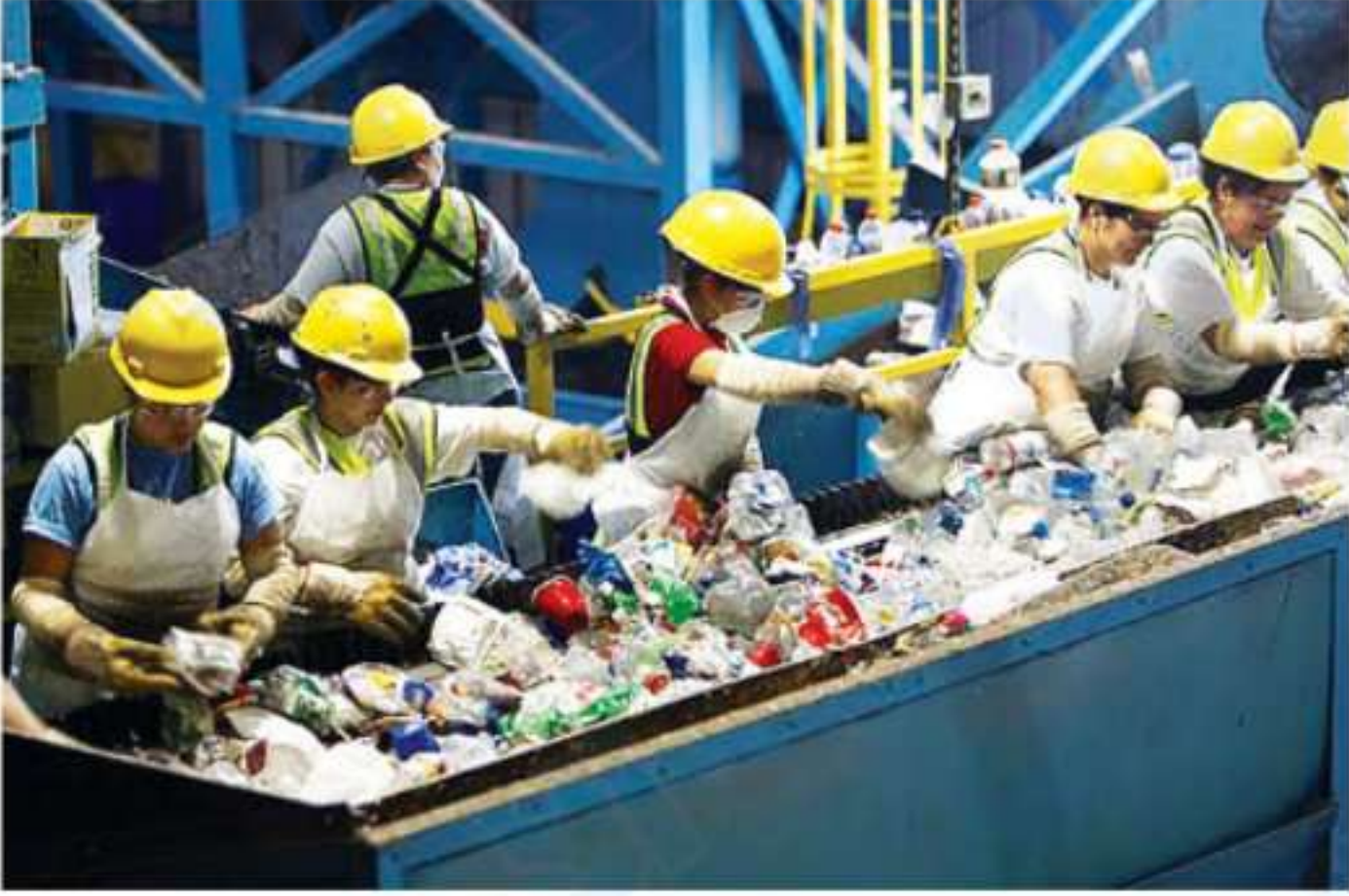
تدوير الزجاجات البلاستيكية